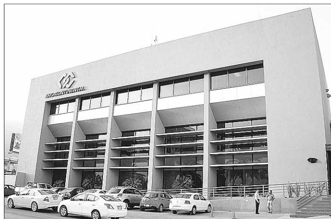
ARCA. La firma mexicana incursiona en Ecuador

gicos para seguir con sus planes de expansión", señaló el reporte de TTR. Con dicha compra la firma mexicana pretende reforzar su presencia en el negocio lácteo donde ya actúa a través de la filial Santa Clara.